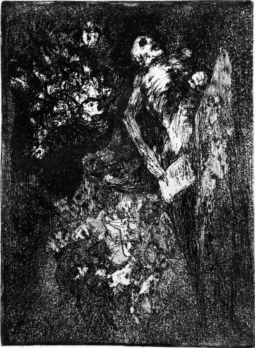
Mada Ulo Bird.