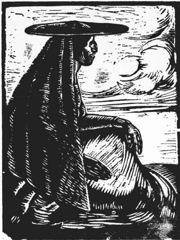
INDIA COLLA, madera de José Sabogal

riente a Occidente, cerrando la curva abierta milenios atrás. Se cumple el avatar: nuestra raza se apresta al mañana; puntitos de luz en la tiniebla cerebral anuncian el advenimiento de la Inteligencia en la actual agregación subhumana de los viejos keswas