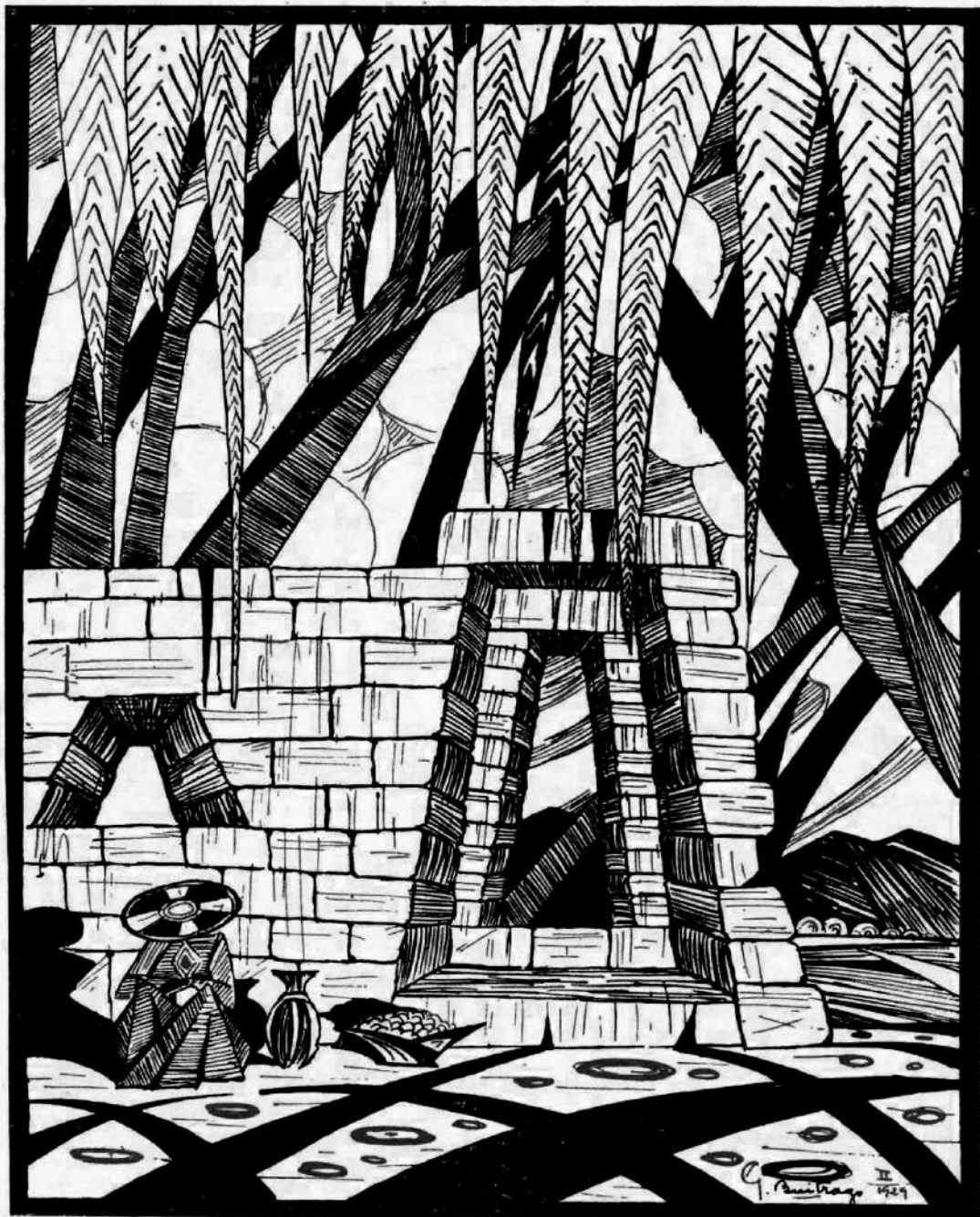
RUINAS INCAICAS, dibujo de G. Buitrago.