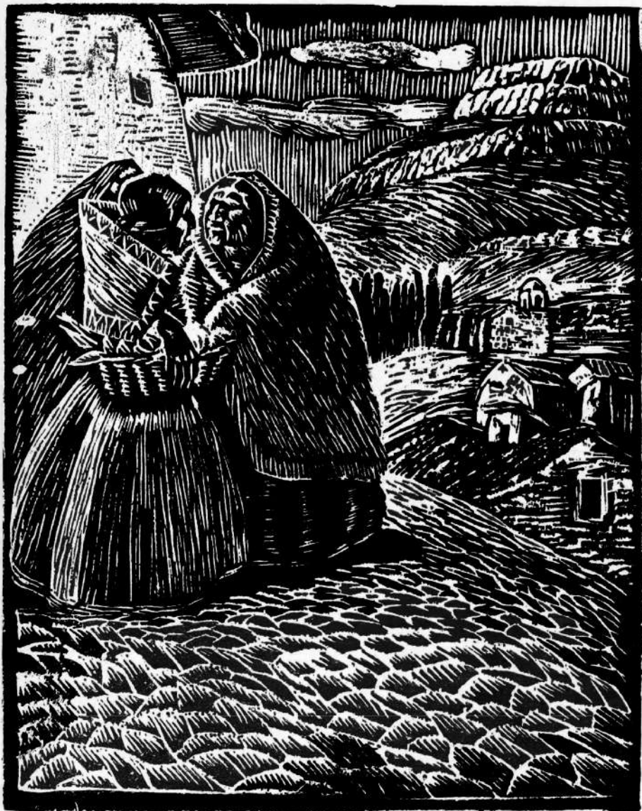
VIEJAS CUZQUEÑAS, madera